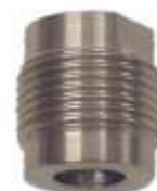
Adaptermuffe XMA-30-1 für Schwinggabel- systeme