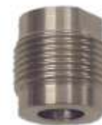
Adaptermuffe XMA-30-1 für Schwinggabel- systeme