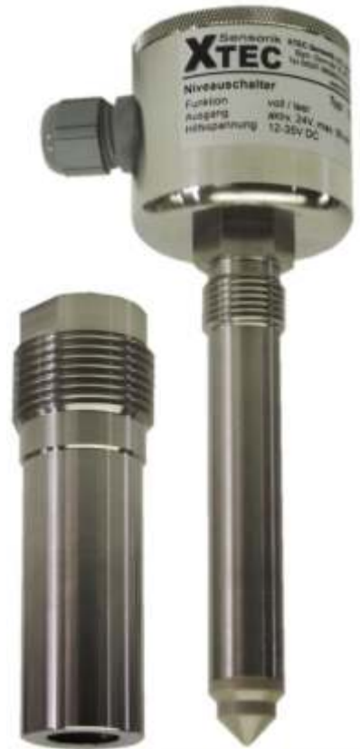
Adaptermuffe XMA-100-1 für Schwinggabelsysteme